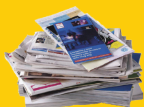
JOURNAUX, REVUES, MAGAZINES