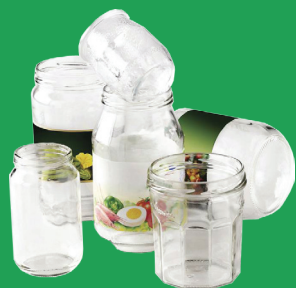
BOUTEILLES, POTS ET BOCAUX EN VERRE