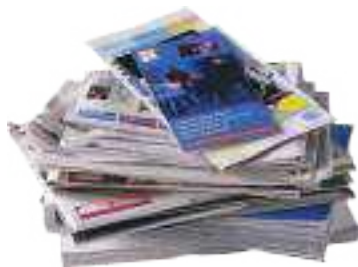
Tous les journaux et les revues débarrassés de leurs films en plastique.