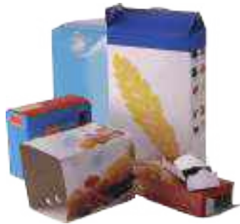
Les emballages en carton : boîte de céréales... et les cartons ne dépassant pas le format des cartons de champagne (les plus gros cartons engendrent des bourrages sur le process de tri).