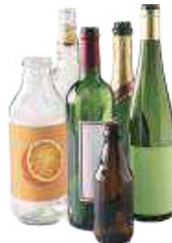
Bouteilles en verre

Le verre culinaire (vaisselles, verres à boire et plats transparents) n'est pas à déposer dans les bornes à verre.