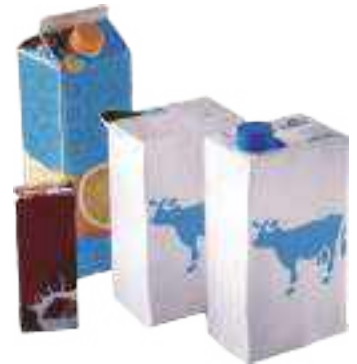
Les briques alimentaires : brique de lait, de soupe, de jus de fruits ...