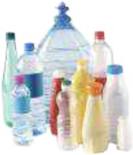
Les bouteilles et les flacons en plastique.