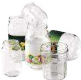
Pot en verre (pot de yaourt, confiture, bocal ...)