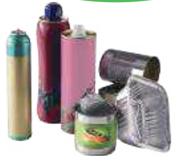
Les emballages en acier et aluminium : canette, boîte de conserve, aérosol ...