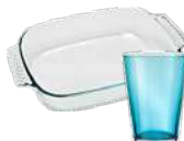
Vaisselle en verre