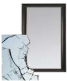
Bris de verre, miroirs

Ces objets ont une température de fusion supérieure à celle des emballages en verre, ce qui a pour conséquence de détériorer la qualité du verre produit.