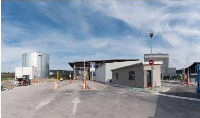
Centre de tri modernisé, le Syvaltri.

Ces travaux ont permis de moderniser l'installation existante afin de l'adapter au mieux suite à la mise en place de l'extension des consignes de tri au 1 er janvier 2023 dans tout le département de la Marne. Ils ont donc permis de mutualiser le tri des emballages plastiques et papiers de 630 000 habitants, mais également d'optimiser la performance technique et financière du tri.