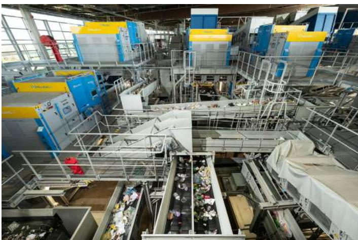
Processus de tri des déchets recyclables pour ensuite être conditionnés et valorisés en fonction des matières.

AGRANDISSEMENT DE LA PROVE- NANCE DES COLLECTES SÉLECTIVES : TERRITOIRE DU SYVALOM ET TERRITOIRES DU SDED 52 ET DU SMET 55 (ENTENTE TRI)