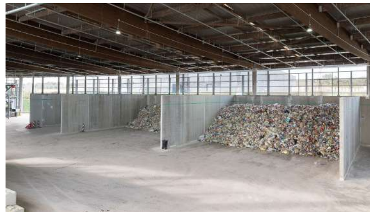
Zone de stockage Amont des déchets recyclables avant d'être triés pour ensuite être valorisés en fonction des matières.

LES SACHETS ET FILMS PLAS- TIQUES, LES POTS, BARQUETTES ET TUBES EN PLASTIQUE, AINSI QUE LES PETITS ÉLÉMENTS MÉTALLIQUES S'Y AJOUTENT