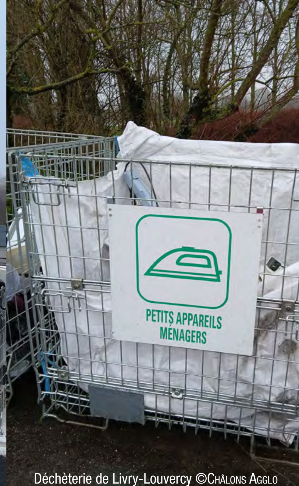
Déchèterie de Livry-Louvercy