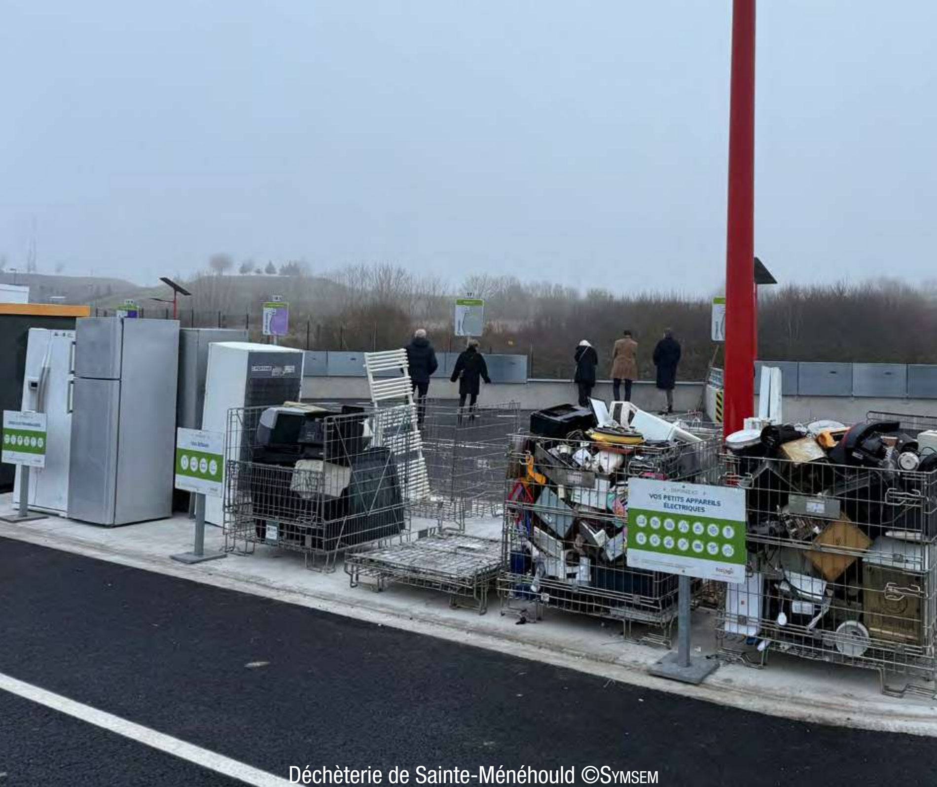
Déchèterie de Sainte-Ménéhould